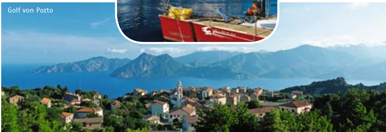
Golf von Porto